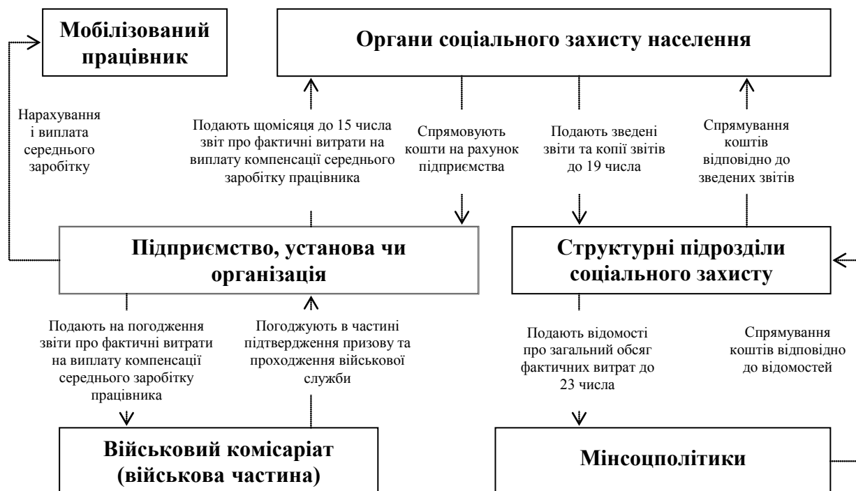
Схема. Механізм виплати компенсації підприємствам у межах середнього заробітку працівників, призваних на військову службу за призовом під час мобілізації, на особливий період, відповідно до Порядку № 105

Механізм виплати компенсації відповідно до Порядку № 105 наведено на схемі.