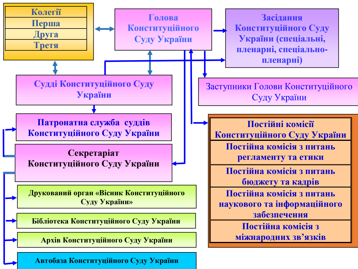
Схема організаційної побудови Конституційного Суду України