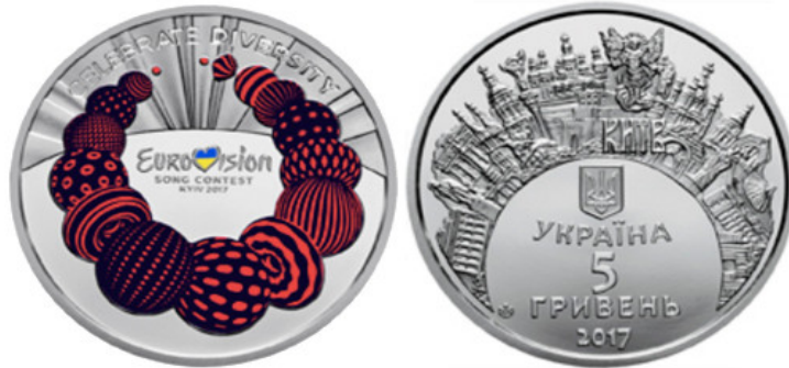
Рис. Пам'ятна монета "Пісенний конкурс Євробачення-2017".

Пам'ятна монета номіналом 5 гривень, введена в обіг 11.05.2017, є дійсним платіжним засобом України та обов'язкова до приймання без будь-яких обмежень за її номінальною вартістю для всіх видів платежів, а також для зарахування на рахунки, вклади, акредитиви і для переказів.