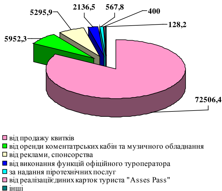
Діаграма. Структура доходів ПАТ "НСТУ", пов'язаних з проведенням Євробачення, тис. грн

Дані діаграми свідчать, що найбільшу питому вагу (83,4 відс.) у структурі доходів від надання платних послуг, пов'язаних з проведенням пісенного конкурсу, становлять доходи від продажу квитків (72506,4 тис. грн); доходи від оренди коментаторських кабін і музичного обладнання – 6,8 відс. (5952,3 тис. грн); від реклами та спонсорства – 6,1 відс. (5295,9 тис. гривень). Найменшу питому вагу – інші доходи (від надання послуг кейтерингу, площ для розміщення пунктів харчування, компенсація за проживання та харчування працівника Laser System Company – 0,2 відс. (128,2 тис. гривень).