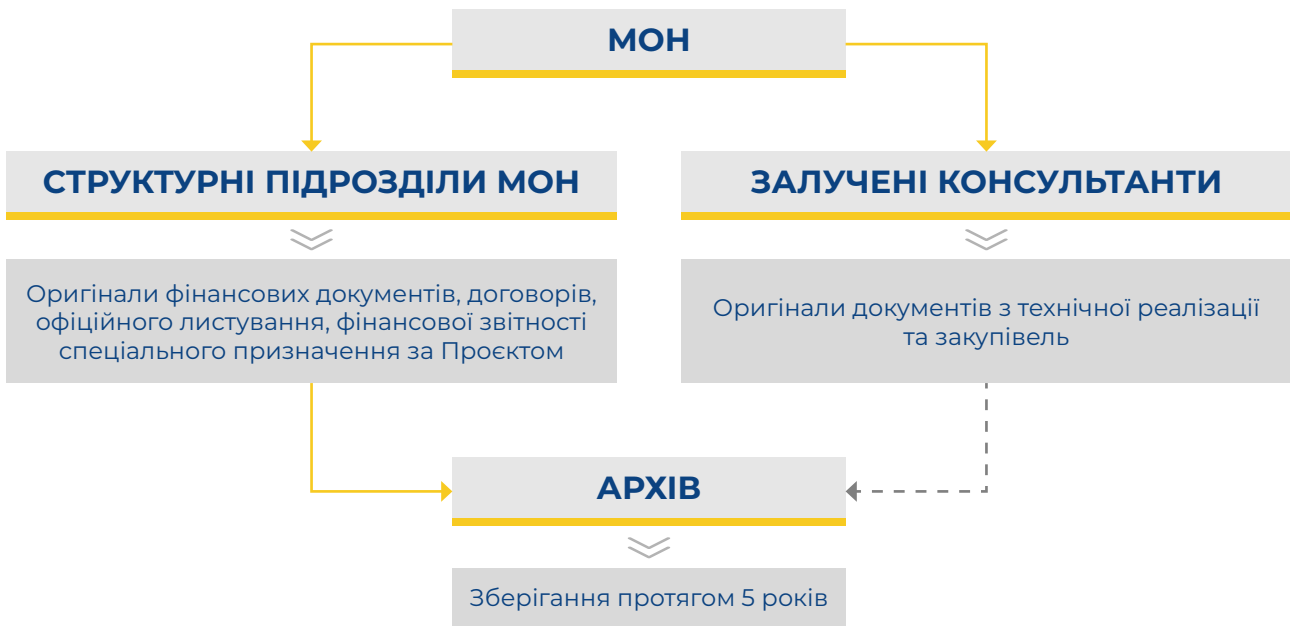
Схема 2. Організація процесу зберігання документації за Проектом

Однак чинні у 2024 році номенклатури справ МОН 7 , які визначають єдині порядки формування, обліку, пошуку та зберігання документів, не містили переліку документів за Проектом, що створюються та зберігаються залученими консультантами. Отже, МОН не створено єдиної системи обліку документів за Проектом. Це свідчить про недостатній рівень внутрішнього контролю за зберіганням та архівуванням документів за Проектом.