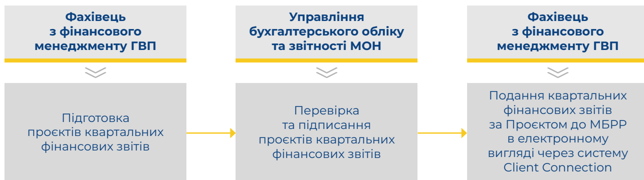
Схема 1. Процес підготовки та подання фінансової звітності спеціального призначення за Проектом

Підготовка фінансової звітності спеціального призначення за Проектом за 2024 рік здійснювалася відповідно до положень Угоди про позику, посібників № 1040 та № 1708 за участю залученого консультанта 2 та працівників структурного підрозділу МОН 3 (схема 1).